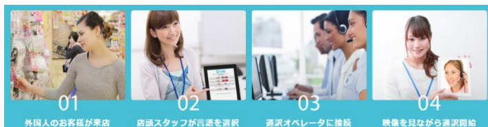
外国人のお客様が来店

最もニーズがある英語、中国、韓国語およびロシア語にくわえ、2013年7月のビザ解禁以降、急激に増加しているタイ人のお客様にも対応できるようタイ語にも対応しています。