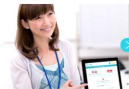
2. 店頭スタッフが言語を選択