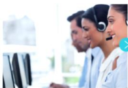
3. 通訳オペレーターに接続