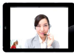
4. 映像を見ながら通訳開始