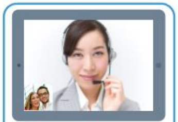
GIGAスクールタブレット の有効活用