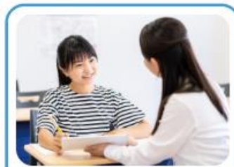
教職員と児童・生徒の コミュニケーションの課題