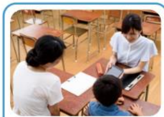
教職員と保護者の コミュニケーションの課題