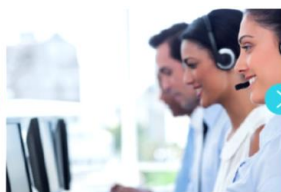
3. 通訳オペレーターに接続