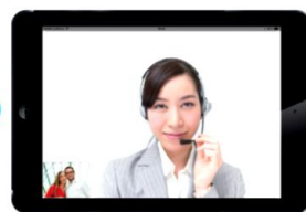
4. 映像を見ながら通訳開始