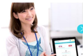
2. 店頭スタッフが言語を選択