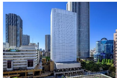
サンシャインシティプリンスホテル ※西武プリンスホテルズ&リゾートの施設で「みえる通訳」を最初に導入

さらに、人件費と比較したコストパフォーマンスの高さや、深夜帯もカバーできる提供時間、通訳者への接続のしやすさも導入の決め手となりました。