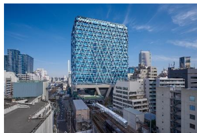
株式会社西武・プリンスホテルズワールドワイド 本社